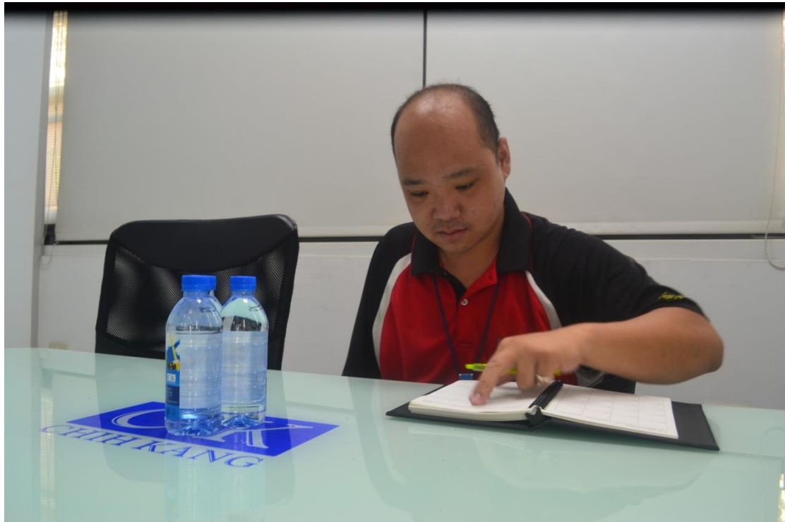
(勞動力發展署推介小遠，到友善職場任職)