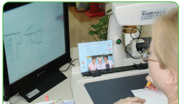
▲小琪現在也不必再緊貼著桌面看字寫字。