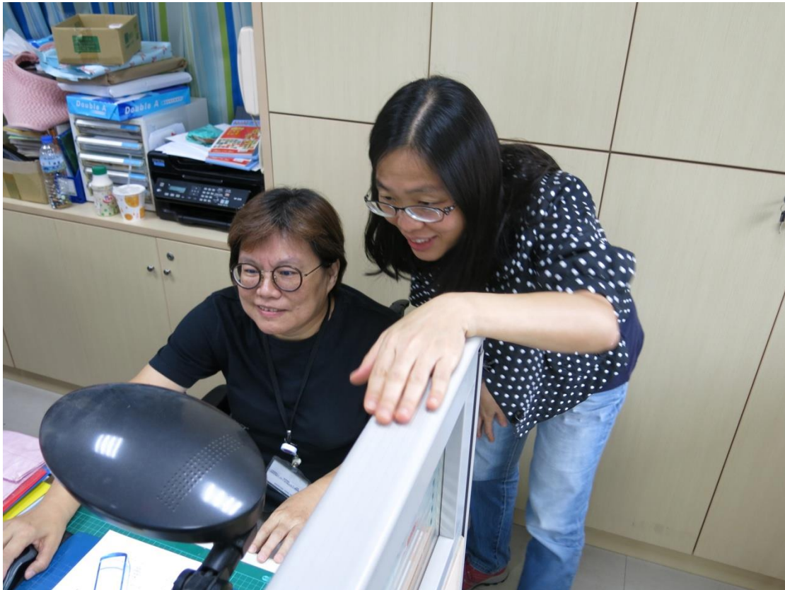
(圖 5-很暖心的花蓮善牧中心)

替身心障礙者辦的職訓課程，也是從那時候開始，接觸電腦打字，學習新工作技能，因為傳統打字機已經逐漸被電腦取代，所以她很感謝打字行老闆，給她這次職訓機會，可以說是自己就業人生的轉折點。