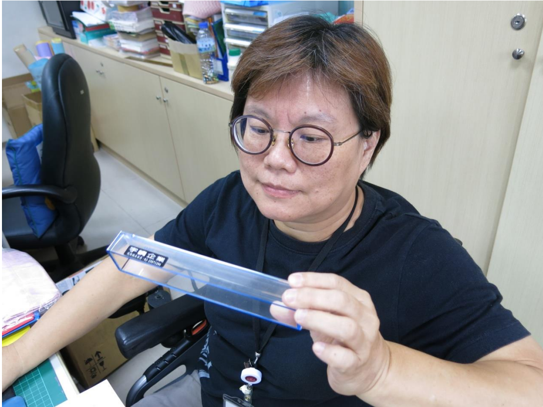
(圖 3-透過輔具再創職場巔峰)

養院，從後山花蓮前進到台北就業，因為那時候剛好有一位學姊介紹她打字的職缺，所以她決定到外面的世界拓展視野。