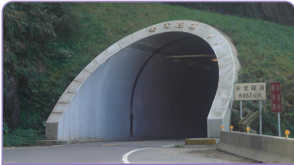
▲九二一震災時大巨石就落在安定彎阻擋園區進出，現已打通並開闢隧道。