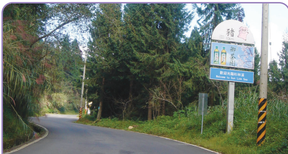
▲經過十二生肖最後一個生肖彎「豬」，杉林溪之美就在眼前。

一早從台中出發，懷著忐忑不安的心前往竹山杉林溪，因為九二一地震後就不曾造訪當地，對杉林溪的記憶仍停留在九二一地