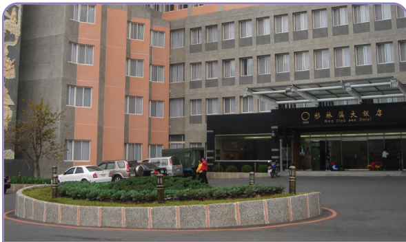
▲杉林溪大飯店去年底重新開幕，重現往日風華。

她以自己為例，九二一震災後，她因擔任總務工作，仍需負責未完成帳款收支工作，所以她領半薪繼續辦理公司災後事務，後來到溪頭米堤，做了一年又碰到桃芝颱風，「我一直記得那天回到家，兒子笑我：『媽！怎麼妳待的公司不是碰上地震就是碰到颱風？』但無論如何，我告訴自己：『能活下來還是最幸運的！』」