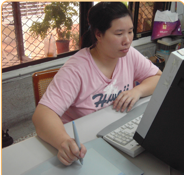
▲電腦及繪圖板的運用，同事可以看著圖做更精確的討論。